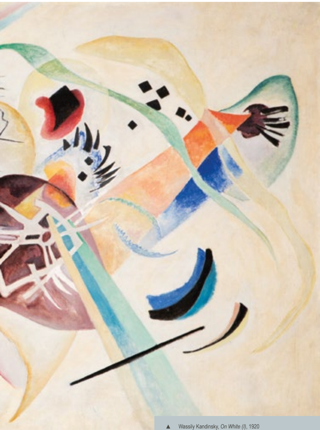
▲ Wassily Kandinsky, On White (I) , 1920 (In copertina) Ilya Repin, 17 October 1905 (particolare) , 1911